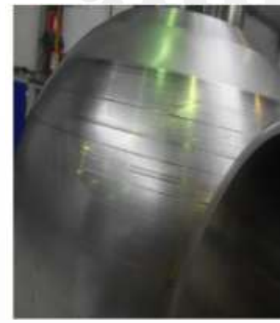
Side A defect (i.e. particular)