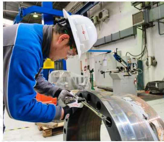
Upgrading of Valves & extra ordinary/complex refurbishment