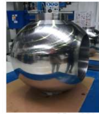
Side A without defect