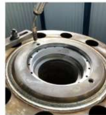
BV 12" ANSI 10000-Overlay welding with Inconel in KZ