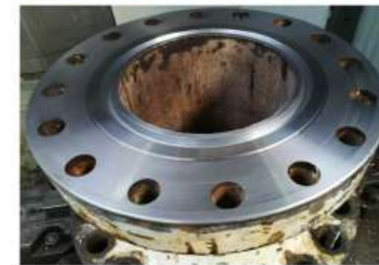
BV 12" ANSI 10000-Machining by Vertical Lathe Machine after Overlay welding