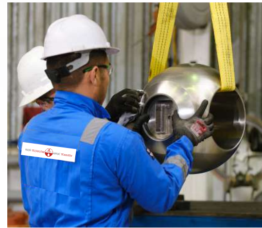
Valves re-engineering solutions according to client's specifications